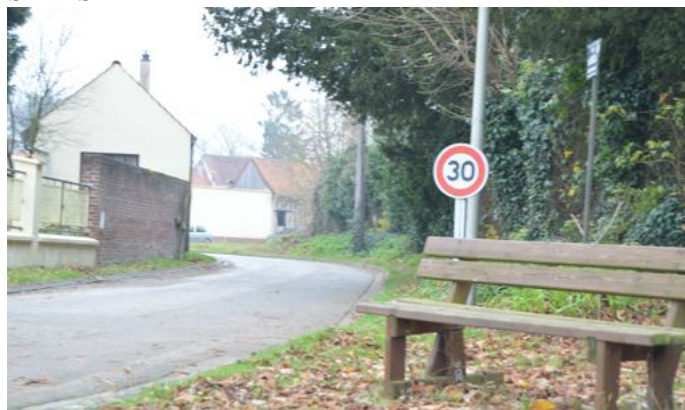
Devant l'entrée du château

Depuis un arrêté du 10 novembre 2016, la vitesse maximale est désormais réduite à 30 km/h rue du château. L'étroitesse de la chaussée et du trottoir justifient un surcroît de prudence des conducteurs dans cette rue, qui est également très fréquentée par des usagers de la plate-forme de déchets verts de la rue de Saint-Saulfieu.