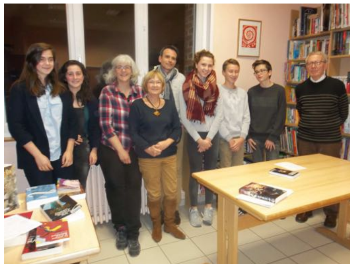
Les lecteurs amateurs de vampires (Mais où est Anaïs ? Volatilisée ?)