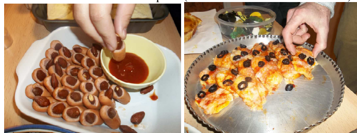
doigts coupés et autres monstres comestibles ...appétissant, non ?