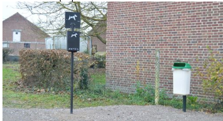
Nous invitons nos amis à quatre pattes et à leur maître à en faire le meilleur usage...

Le chemin qui traverse cet espace a été regarni en graviers par les employés communaux. Le site accueille désormais une « borne de propreté canine » et une corbeille