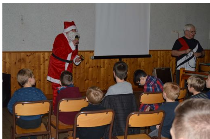
Le Père Noël a bien précisé le travail des rennes.

Le Noël des enfants de Rumigny a réuni une trentaine d'enfants de 3 à 10 ans à la salle des fêtes...et une quarantaine d'adultes ! C'est à l'issue de la projection du film « Opération Casse-noisette » que le Père Noël a fait son apparition et distribué ses cadeaux.