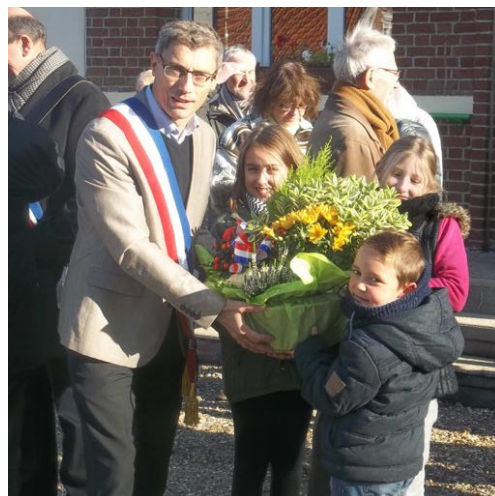
Félicitations aux enfants qui viennent fleurir le monument aux morts