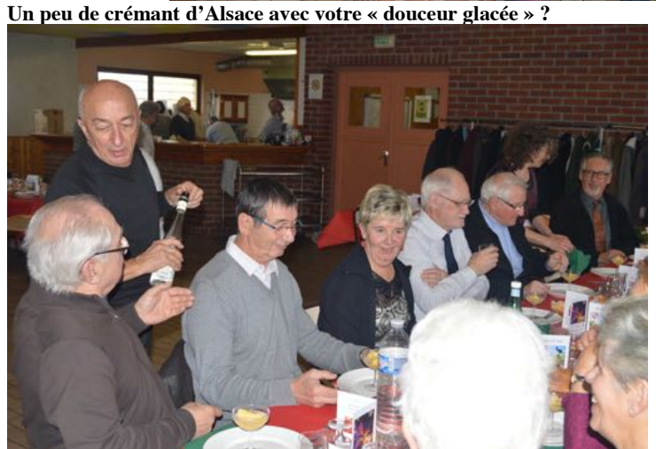
Un peu de crémant d'Alsace avec votre « douceur glacée » ?