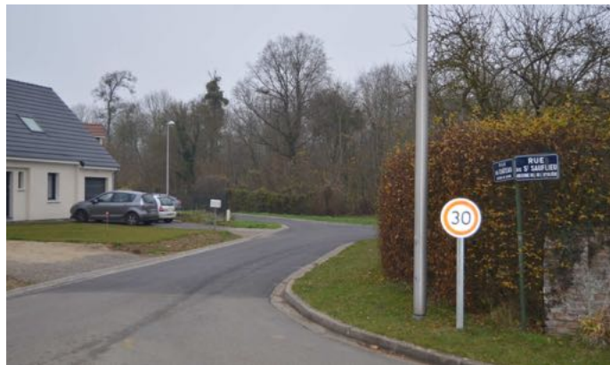
Côté rue de Saint Saulfieu