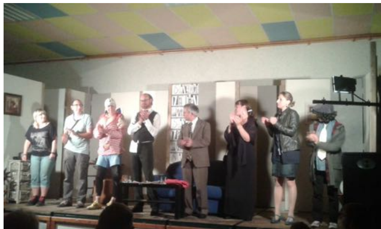
La troupe au grand complet...