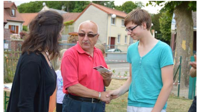
Félicitations à tous, et rendez-vous à l'année prochaine !