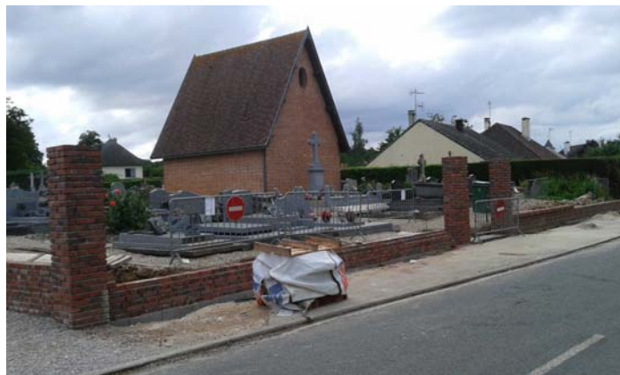
Un chantier rondement mené

Les travaux se poursuivent, avec la réalisation en juillet du soubassement en brique de pays, puis la maçonnerie de parpaings. Le chantier pourrait être achevé en septembre. L'accès piéton a d'ores et déjà été rétabli. L'allée principale sera pavée pour faciliter l'accès aux personnes à mobilité réduite.