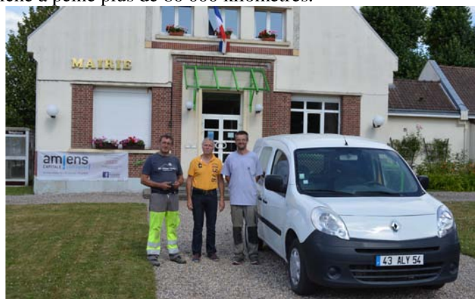
Le Kangoo communal, à son arrivée devant la mairie