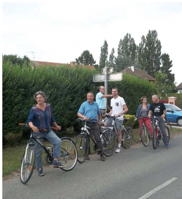
Le conseil municipal sur le terrain

Pour 4500 euros TTC (sur lesquels le Département nous reverse 20% de subvention), ce Kangoo fraîchement repeint affiche à peine plus de 80 000 kilomètres.