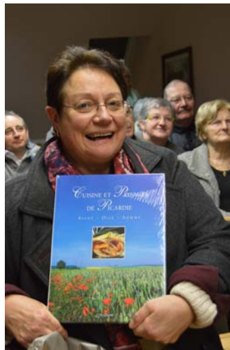
Cadeau pour la Trésorière !