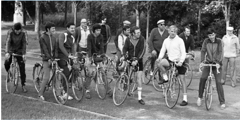
Les « pros » posent avant le départ

Les parcours se faisaient à pied, à vélo (tranquille ou sportif) et en auto pour les aîné(e)s, avec le ravitaillement !