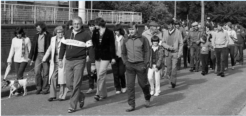
Le grand départ pour 17 km vers Glisy