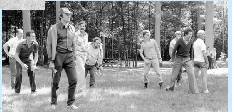
Partie de « Jacques a dit... »