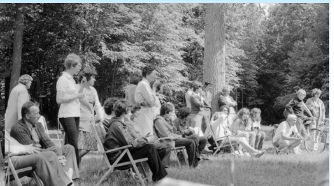
Les spectateurs n'en manquent pas une, et ils étaient nombreux. Vous en étiez peut-être...