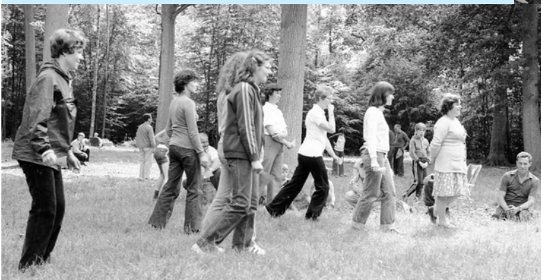
Les enfants s'amuse

Ces photos nous ramènent au début des années 80. Des personnes présentes sur ces clichés nous ont quittés. C'est l'occasion de nous souvenir d'elles.