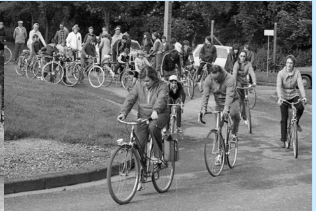
Le tour de France n'est pas loin. Les cracks sont partis, la tête dans le guidon...