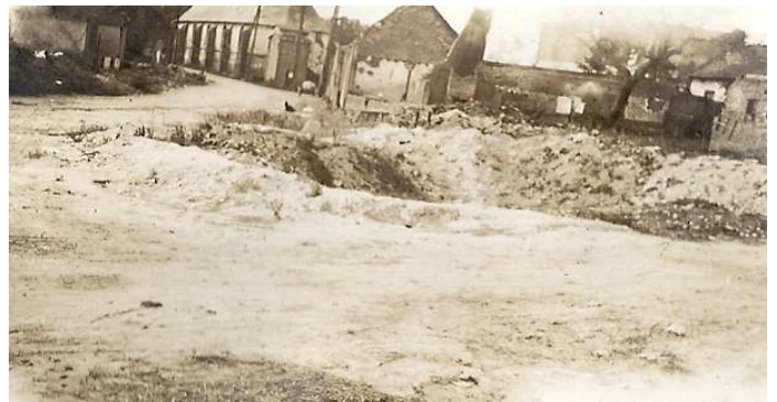
Ruines dans Rumigny telles que les habitants les ont retrouvées à leur retour d'évacuation (1). Photo qu'on peut situer rue du Quai. (1).