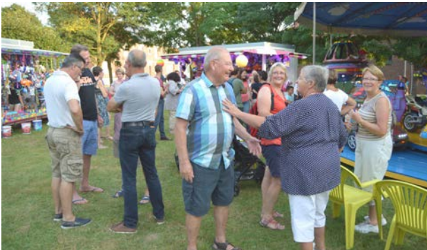
Le « parcours du cœur » du 10 septembre