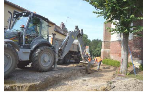
Le chantier du parking pour personnes à mobilité réduite.