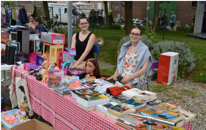
Jouets et livres à petit prix.