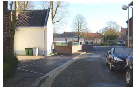
Le parking terminé.