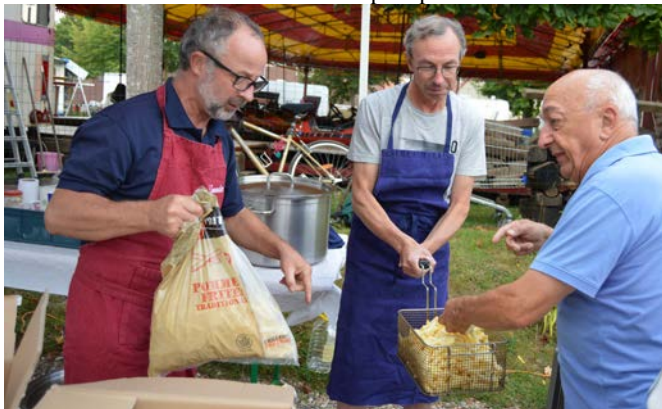
Au Comité, on ne plaisante pas avec la qualité des frites !