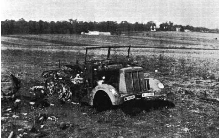
Auto à chenille allemande détruite à Dury (2)

De nouveaux rassemblements de chars sont observés à l'Est de Saint Fuscien et au Nord de Sains en Amiénois. Vers 16 heures, depuis l'Est de Sains, les batteries françaises du Bon Air et du bois de Camont sont attaquées, ainsi que la ferme de la Racineuse. L'infanterie allemande se prépare près du cimetière de Sains.