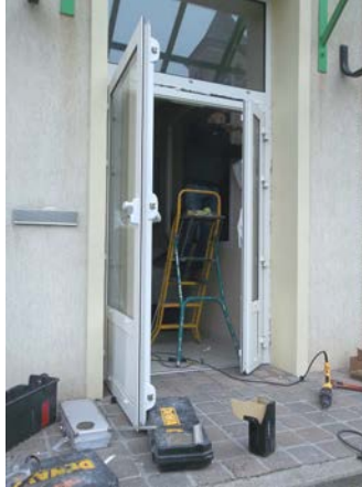
La nouvelle porte de la Mairie adaptée aux personnes à mobilité réduite.

La municipalité poursuit son programme d'aménagements et de rénovation, certains confiés à des entreprises, d'autres aux employés communaux : La porte de la Mairie a été changée par l'entreprise FLAMAND, de Rumigny, (avec une aide du Député, Romain JORON) afin de permettre l'accès aux personnes à mobilité réduite. La porte principale de l'église a été entièrement décapée et repeinte. La même opération est en cours sur la porte latérale. Un parking pour personnes à mobilité réduite a été réalisé à proximité de l'église et de la Mairie (avec une aide de l'Etat). Le cheminement de pavés vers la Mairie a été ajusté.