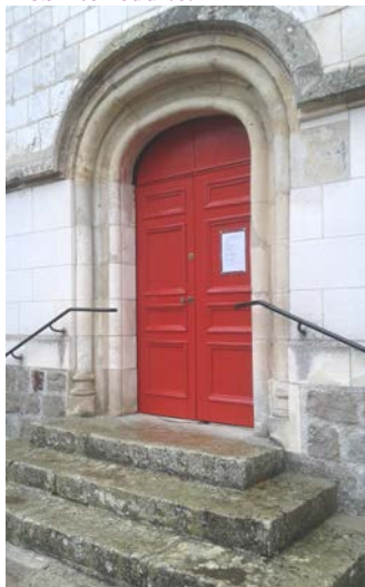
La porte de l'église et ses mains-courantes ont retrouvé des couleurs !