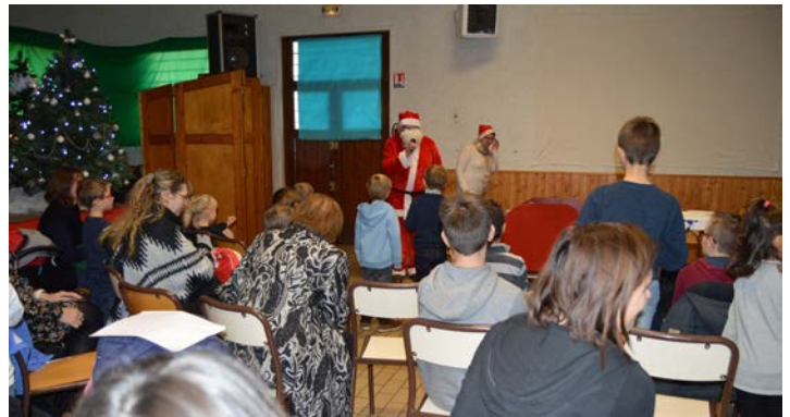
Le Père Noël n'a pas oublié l'étape 2017 de Rumigny, le 16 décembre.