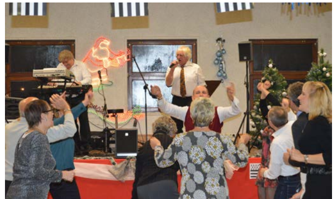
D'autres photos sur : http://www.rumigny.fr/category/actualites/