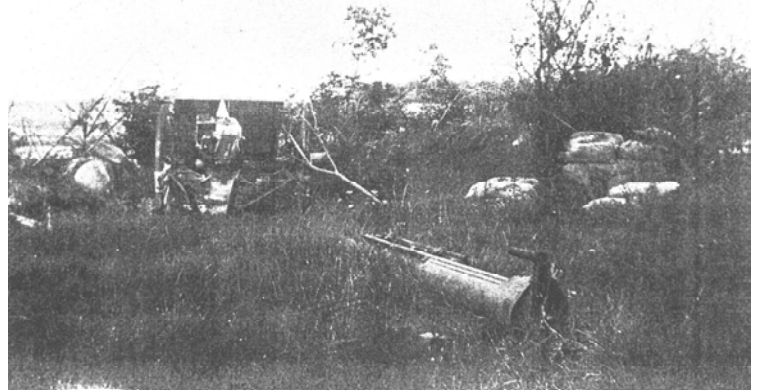
Pièce de 75 détruite par ses servants en lisière Nord de Rumigny (2)

Vers 4 heures du matin, le colonel Bourquin décide d'édifier une barricade à l'entrée ouest de Rumigny.