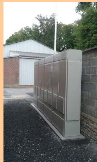
Une armoire à la mesure de nos attentes ?