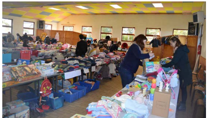
La bourse puériculture du 19 novembre a rencontré un grand succès.