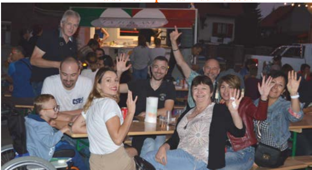
Le lundi de la fête de la commune – le 28 août