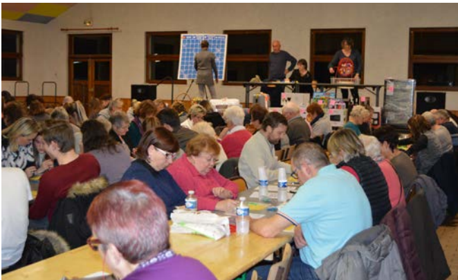
Les lots proposés par le Comité étaient de qualité !