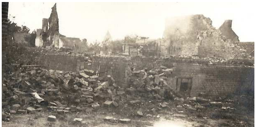
Scènes de désolation dans Rumigny après les combats (1)