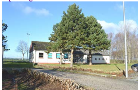
La haie de la salle des fêtes, fortement dégradée, a été taillée sévèrement, afin de la rajeunir, et débarrassée des piquets de fer qui l'encombraient.