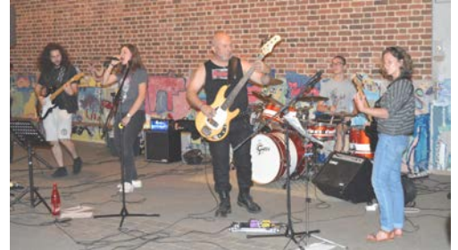
Dernière prestation pour le « RockGang » d'AMADEUS !