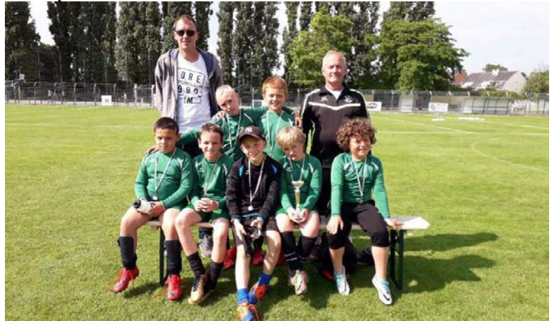
Les U9 de la saison 2017-2018