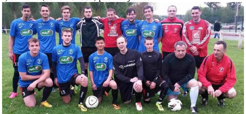
Les seniors (saison 2016-2017)