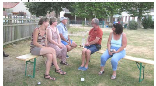
On laisse les boules se refroidir entre deux parties...

D'autres photos sur : http://www.rumigny.fr/category/actualites/