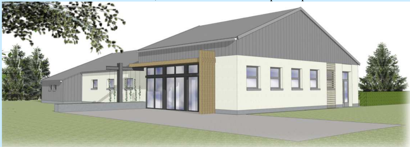
Vue de la salle après rénovation, côté sud.