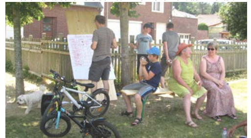
Un peu d'ombre en ce début d'été caniculaire...