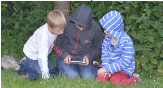
où les jeunes voisins préfèrent...les jeux vidéo !!!