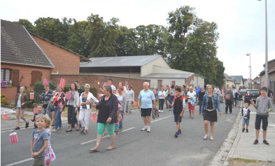
La retraite aux flambeaux est passée par la rue de Saint Sauflieu...