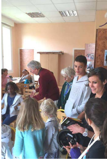
Presque tous les enfants avaient apporté un dessin.

Il n'y eut que des gagnants à ce concours informel qui, le temps d'une semaine, devait donner lieu à une modeste mais attachante exposition dans le hall d'entrée de la mairie. Merci à toutes les personnes qui ont collaboré à cette lecture, que ce soit sur place ou en amont pour le choix des textes.