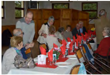
Samedi 20 avril Chasse aux oeufs (C) Salle polyvalente