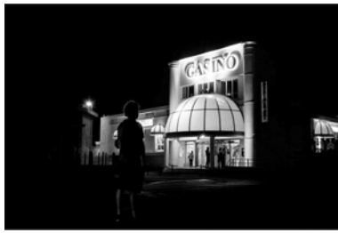
Dimanche 10 mars Repas de printemps (CA)