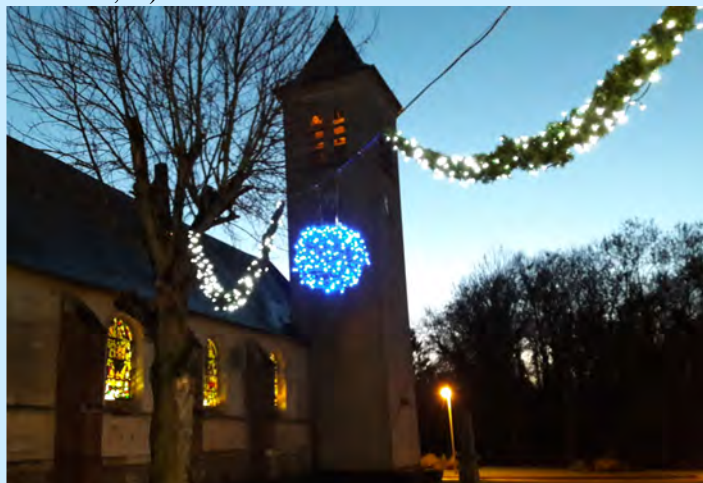
Des guirlandes récupérées gratuitement dans le stock de la ville d'Amiens, qui ne consomment que très peu, et que l'on éteint pendant la nuit...un exemple parmi d'autres d'économies judicieuses !

Quant aux recettes, et dans la mesure où le Conseil Municipal s'abstient durablement d'augmenter le taux des taxes foncière et d'habitation, il ne reste guère que les tarifs de ses services qu'elle peut ajuster à la marge (concessions, locations,...).