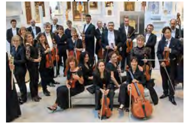
Dimanche 28 avril Grand prix de Rumigny cycliste (C)