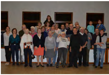
Mardi 5 mars Visite du camion LAURE (thermographie)

Samedi 26 janvier Assemblée générale du Comité des fêtes en Mairie à 17h (CF)