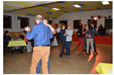
Dimanche 17 mars Concert de l'orchestre de Picardie Salle polyvalente (C)

Samedi 2 mars Soirée dansante (CF) Salle polyvalente