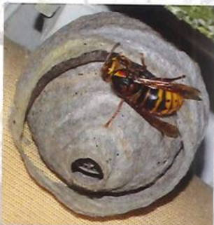
Nid primaire de frelon européen

Le nid primaire du frelon asiatique héberge 20 à 30 insectes. Il est généralement construit dans un endroit abrité à hauteur d'homme (ruche vide, cabanon, trou de mur, bord de toit, roncier...). L'orifice de sortie est situé à la base.