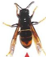
Frelon asiatique (taille réelle 3 cm)