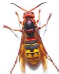
Frelon commun (jusqu'à 4 cm)