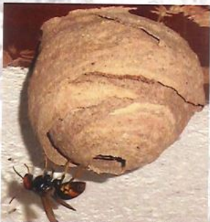
Nid primaire de frelon asiatique

Le nid primaire du frelon asiatique héberge 20 à 30 insectes. Il est généralement construit dans un endroit abrité à hauteur d'homme (ruche vide, cabanon, trou de mur, bord de toit, roncier...). L'orifice de sortie est situé à la base.